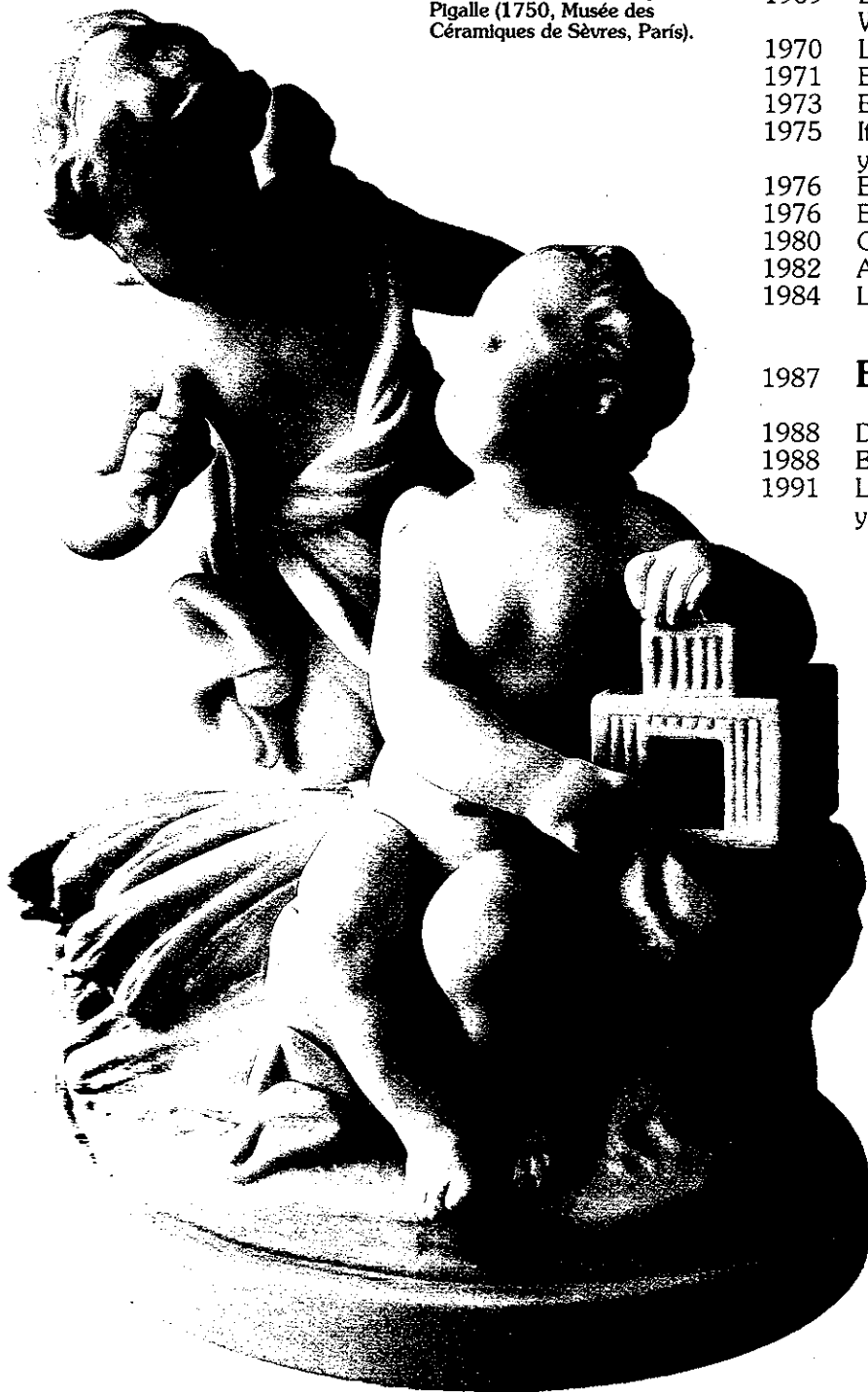
El niño de la jaula, una composición de Jean-Baptiste Pigalle (1750, Musée des Céramiques de Sèvres, París).