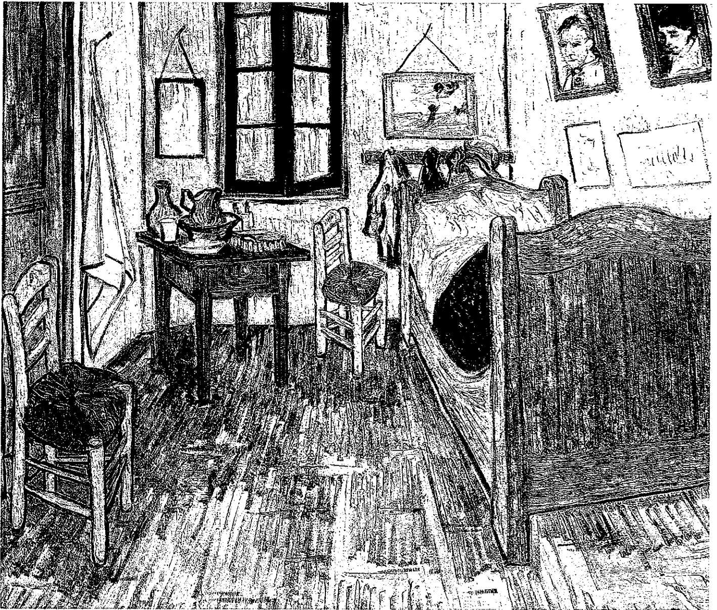
La habitación de Van Gogh en Arles (1889, Museo de Orsay, París) representa el cuarto de la pensión en la que estuvo el pintor desde febrero de 1888 hasta mayo de 1889. En una de las muchas cartas escritas a su hermano Leo, le describe minuciosamente los colores y la técnica que iba a emplear en su habitación de Arles para conseguir una sensación de reposo absoluto.

2253 LOS MÁRGENES DEL PROGRESO 2254 Los Nazarenos 2255 Los Prerrafaelitas 2260. El triunfo de la pintura pompier