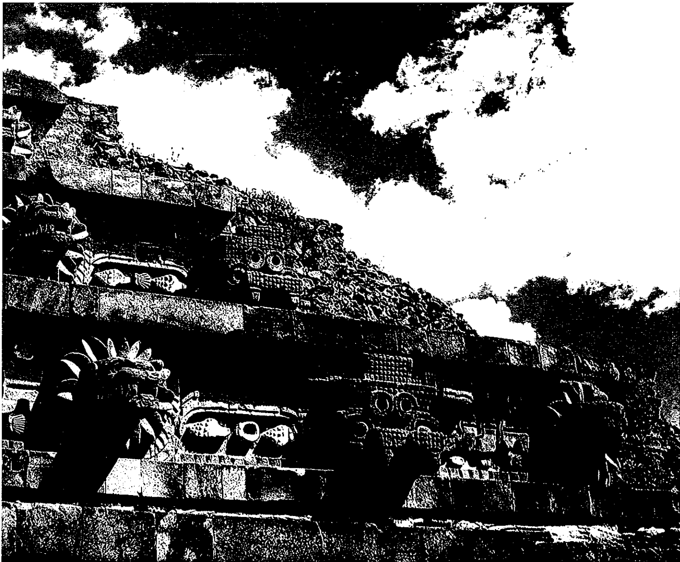
Detalle de los frisos de la pirámide del templo de Quetzalcóatl, en Teotihuacán (México). En ellos se intercalan cabezas de Tlaloc, el dios de la lluvia, con otras de Quetzalcóatl, la Serpiente Emplumada.